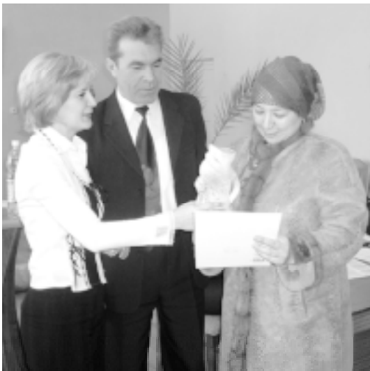
Грамоты и памятные подарки были вручены лучшим работникам

во фонд сформирован в размере 3 142 тыс. руб., это в 87 раз больше, чем в 2004 году. Сформирован в необходимом объеме резервный и другие фонды кооператива. Цифры, надо сказать, небольшие, но мы не гонимся за большими объемами, для нас главное – качество предоставляемых кооперативом услуг и надежность наших партнеров и членов кооператива!