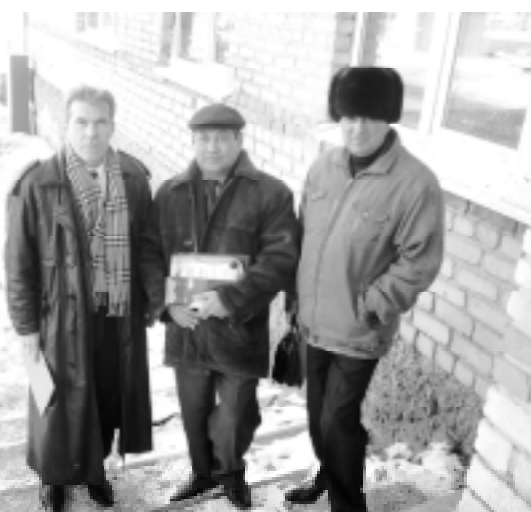
На крыльце нового офиса.

С ростом кооператива вырос до шести человек и штат сотрудников исполнительной дирекции. Теперь в штате кооператива, кроме Председателя и главного бухгалтера, есть исполнительный директор, специалист по займам, бухгалтер - кассир и